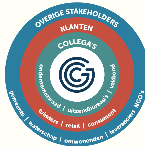
Overzicht van de invloedssfeer van geïdentificeerde stakeholders.

Het actieplan bevat concrete acties, die voortvloeien uit het wederzijdse belang van zowel Gipmans als de stakeholders. De acties zijn 'smart' en in het licht van bredere maatschappelijke verwachtingen opgesteld.