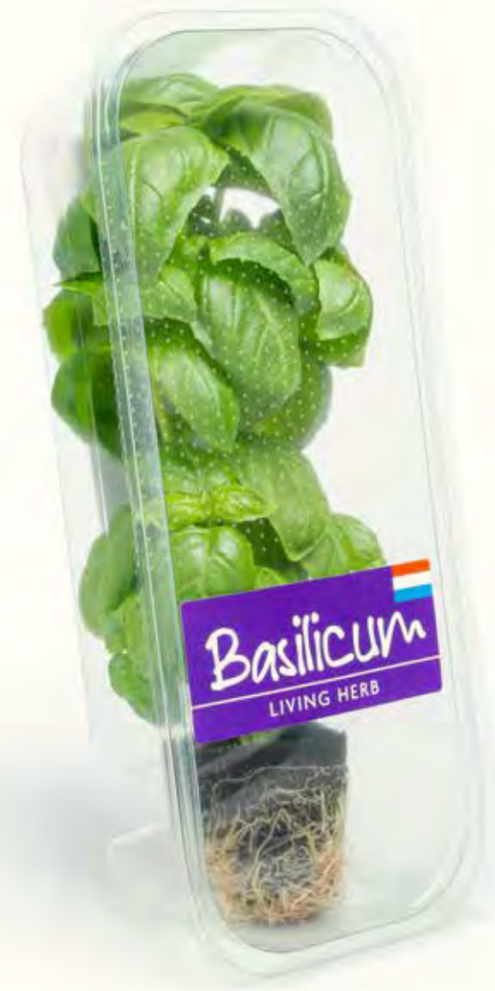
Mighty Mini's - Living Herbs

In het genoemde document 'Relevantie, Significantie en Prioriteit van ISO26000 Onderwerpen', is de prioriteit van de onderwerpen geschat tussen L (Laag), M (Middel) en H (Hoog). De onderwerpen met hoge prioriteit zijn als H aangeduid, met een toelichting. Hieruit wordt ondubbelzinnig duidelijk welke onderwerpen voor Gipmans echt prioriteit hebben.